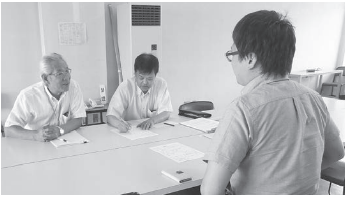
2名の相談員がていねいに対応します