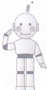
「コウちゃん」 工業統計調査イメージキャラクター