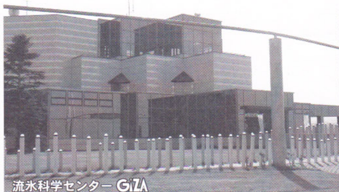
流水科学センター GIZA