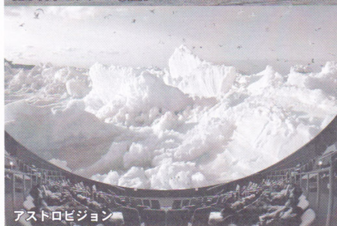
アストロビジョン