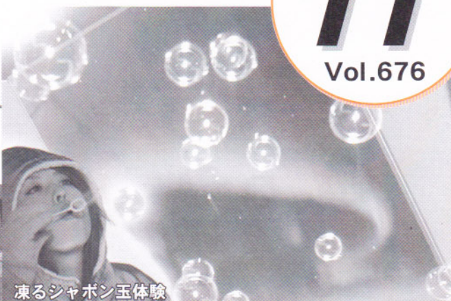
凍るシャボン玉体験