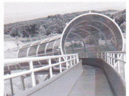
ローラーすべり台

利用期間 年中無休(12月29日～1月3日除く) ※冬期間は一部利用できない施設がありますので、詳しくは、お問い合わせください。 利用時間 9時～17時まで