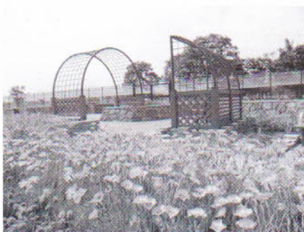
やすらぎ体験農園

今春オープンした、地域住民が主体となって管理する「やすらぎ体験農園」、家族や職場の仲間と気軽にバーベキューなどが楽しめる「ピクニック広場」も人気を呼んでいます。※「ピクニック広場」の屋根付き野外炉の利用には予約が必要です。