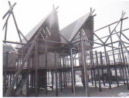
竪穴式コンビネーション遊具