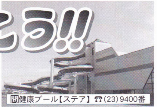
健康プール【ステア】 ☎(23) 9400番

今年で20周年を迎える紋別市健康プール「ステア」、この夏、子ども同士やご家族連れでステアに行って、オホーツクの夏を楽しみましょう!!