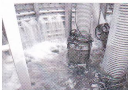
「豊富な原水が流れ込む様子」

このように、第二水源設備は、非常時においても市民の皆さんへ安全で安心な水を供給する役割を担っています。