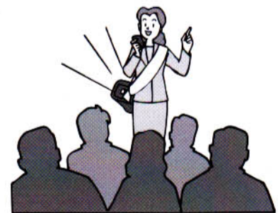
園企画調整課企画係 ☎内線221番