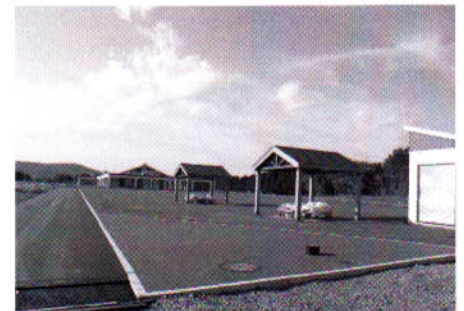
「ピクニック広場」（来春開園予定）