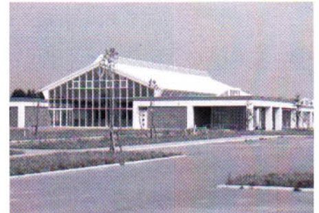
「あおぞら交流館」外観