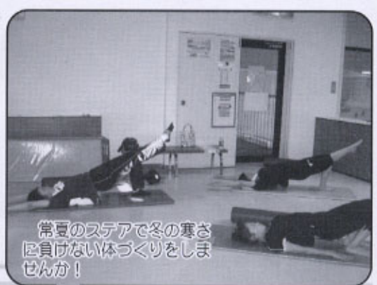
「常夏のステアで冬の寒さに負けない体づくりをしませんか！」

10時より競技終了(13時予定)までの間、競技プールが利用いただけませんので、理解と協力をお願いします。