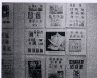
▲ばらの切手 (小竹 信夫さん)