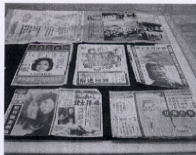
▲映画、観劇のパンフレットなど (笠井 智絵さん)