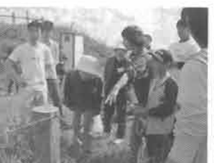
計画地をみんなで歩きながら、植物などを観察。先生役は住民ボランティア。