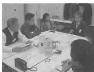
大人の参加者が公園計画について考える意見交換会の様子。たくさんのアイデアが出されました。

オホーツク流氷公園では、構想の段階から計画づくりに住民が参加しています。計画地を歩きながら敷地の良さを再発見するワークショップを開催するなど、地域密着型の公園づくりを行っています。