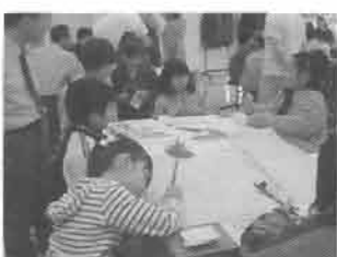
子供達も一生懸命公園の遊具などについて考えました。