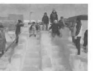
もんべつ流氷まつりにワークショップチームが滑り台づくりで参加。公園をPRしようと盛り上げました。

※ワークショップ=住民と行政が話し合いや作業の場を持ちながら協働で何かを行うこと。