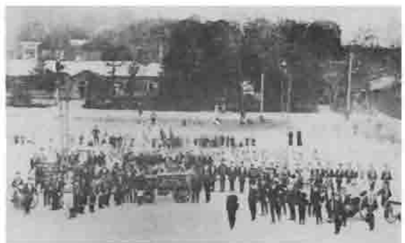
大正12年6月 春期消防演習記念(紋別尋常高等小学校前)