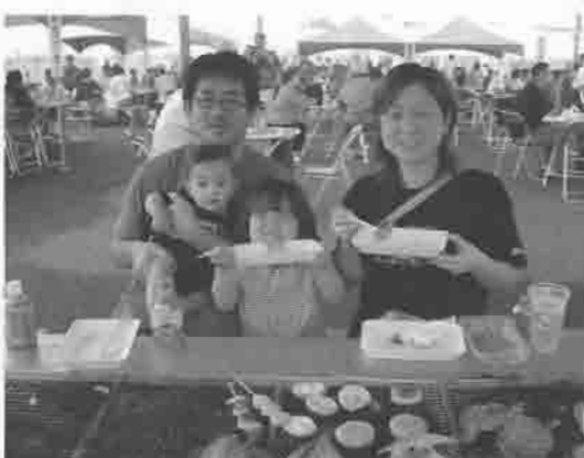
9月18日～20日迄の3日間、紋別市海洋公園イベント広場にて行われた「オホーツク食彩フェスタ2004」の様子です。好天に恵まれ多くの家族連れで賑わいました。