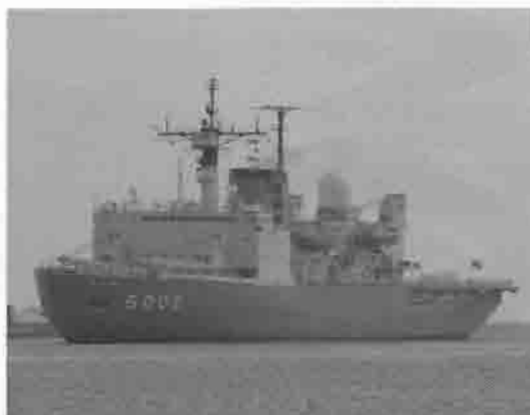
南極観測砕氷艦「しらせ」紋別港入港(9月10日(金))

問合せ先 オホーツク DO いなか博紋別市実行委員会事務局 〒094-0005 紋別市幸町5丁目24番1号オホーツク交流センター内 ☎④2004 FAX:④2044 公式ホームページ http://www.do-inaka.net/ オホーツク DO いなか博「ふれあい館」 〒094-0023 紋別市海洋公園1番地 海洋交流館内 ☎④2005