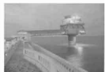
オホーツクタワー

問い合わせ先 紋別観光周遊バス運行協議会 ☎ 2117・北紋バス(株) ☎ 2165