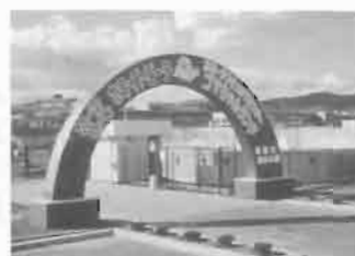
ゴマちゃんランド