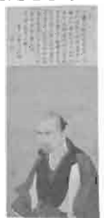
重文 佐藤一斎像 渡辺華山筆〈江戸時代〉