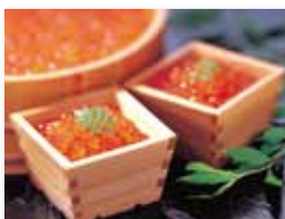
いくら醤油漬(冷凍)